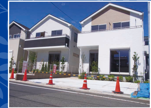
※本施工例は建築請負会社の実績の一例であり、左記物件の建築とは関係ございません。

(公社)首都圏不動産公正取引協議会加盟 (公社)神奈川県宅地建物取引業協会会員 (公社)全国宅地建物取引業保証協会会員 神奈川県知事免許(6)第21255号 〒253-0021 神奈川県茅ヶ崎市浜竹3-3-37 アスール湘南1F